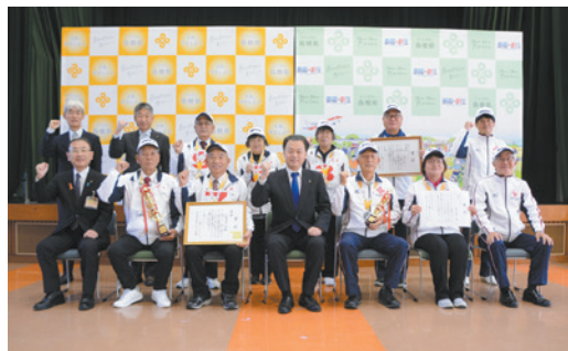
知事報告会の様子

重ねた成果を出していただきました。皆さんは健康長寿の見本。後に続く方々がたくさん出てきてほしいと思います」と期待しました。