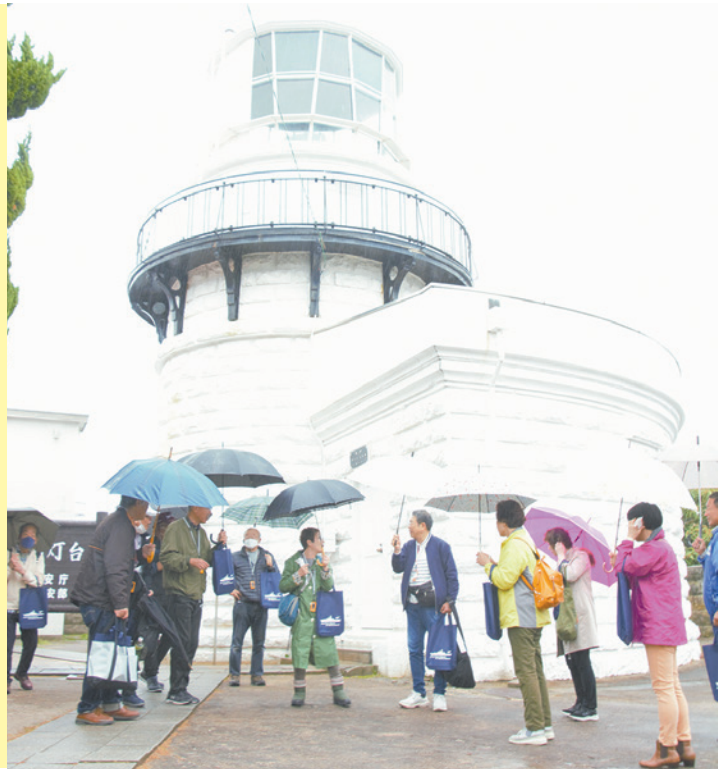
美保関灯台 明治31(1898)年に建てられ、明治の面影をとどめる美保関灯台を見学する学園生＝松江市美保関町地蔵崎

9月にスタートしたくにびき学園東部校33期生が11月10日、門前町として栄え、北前船の往来で発展した港町の風情が残る松江市美保関町を巡る現地学習を行いました。本殿が国の重要文化財に指定されている美保神社周辺や美保関灯台をはじめとする地域の貴重な文化遺産に触れ、観光や地域振興を進める地元の取り組みも学びました。