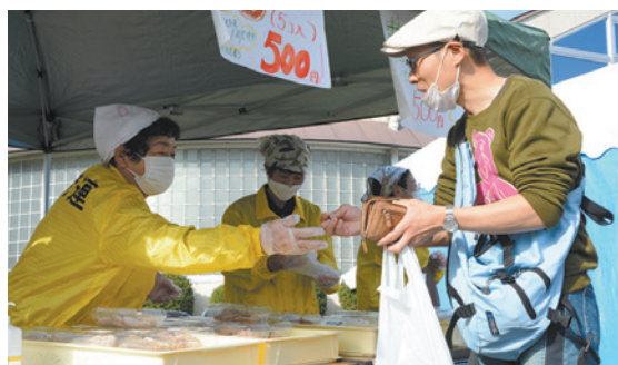
きん祭みん祭農業文化祭でとちもちの販売

5日の六日市会場に設けられた同連合会のブースには知人らが次々と訪れて買い求めていました。11月19日に開催された柿木会場では、高津川でとれたアユを使った鮎飯を販売。こちらも大人気だったということ。