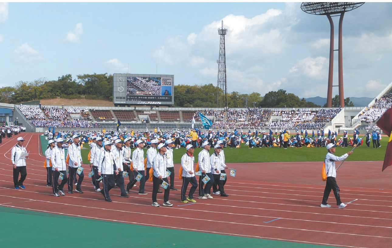
総合開会式の入場行進

全国の高齢者がスポーツや文化活動で交流を深める第35回全国健康福祉祭えひめ大会(ねんりんピック愛顔のえひめ2023)が10月28日から31日までの4日間、愛媛県内で開催されました。島根県勢は22種目に出場、ゲートボールで伊野チーム(出雲市)が県勢初の優勝を果たすなど、選手143人が堂々の活躍を見せました。