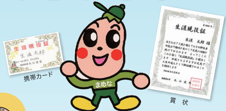
健康長寿しまねマスコットキャラクター まめなくん

※原則申請のあった月の翌月にお送りします。 ※推薦の場合は、推薦者に「生涯現役証」をお送りします。