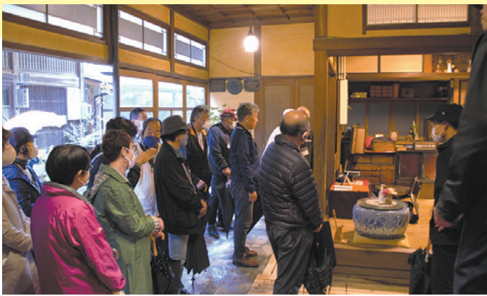
美保館 青石畳通りにある登録有形文化財の美保館本館を見学する学園生＝松江市美保関町美保関

2022年に集計を始めてから過去最高の60万人台の参拝者を記録した美保神社では、本殿や拝殿をはじめ