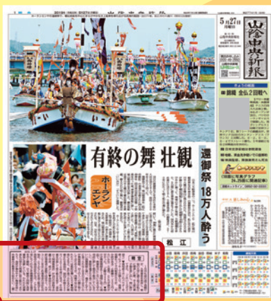
山陰中央新報1面のコラム「明窓」の専用ノートです。