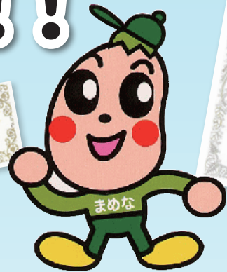
健康長寿しまねマスコットキャラクター まめなくん