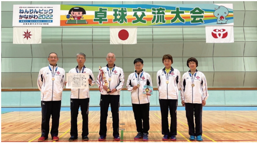
卓球チーム「神話のくに島根」の皆さん =横須賀市不入斗町、総合体育館メインアリーナ